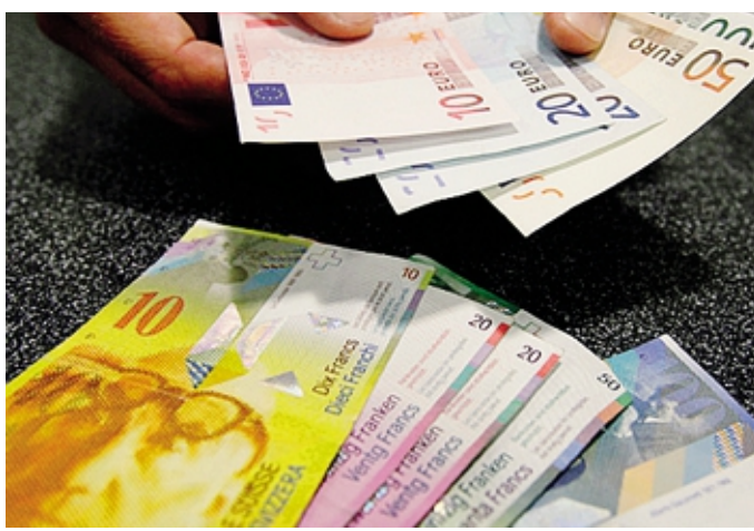
In Italia la situazione sembra essere in miglioramento

Secondo le simulazioni che sono state pubblicate a marzo, si possono invece evidenziare alcune modifiche che migliorano le condizioni di vita familiari riducendo le disuguaglianze: dall'assegno unico e universale per i figli a carico al reddito di cittadinanza, inclusa l'introduzione del Supporto per la formazione e il lavoro (SFL), fino all'esonero parziale dei contributi previdenziali per i lavoratori dipendenti. Questo porta gli analisti a dire che «nel complesso, le modifiche al sistema di tasse e benefici introdotte nel corso del 2023 aumentano in lieve misura l'equità della distribuzio-